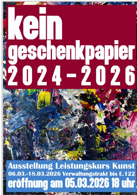
Ausstellung des Leistungskurses Kunst demnächst am GM

Liebe Schülerinnen und Schüler, liebe Eltern, anbei die wichtigsten Termine für die nächste Woche: