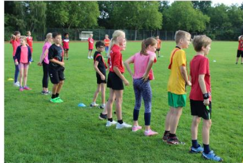
Volle Konzentration beim Sportfest des 5. Jahrgangs