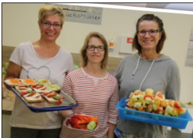
▶ Gesundes Schulfrühstück